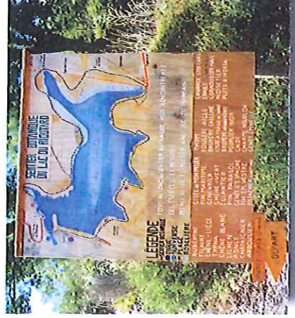
PANNEAU SUR LE SENTIER BOTANIQUE

« Respire ». Ce sentier situé autour du lac comporte une trentaine de panneaux botaniques mettant en valeur les espèces végétales méditerranéennes : pin parasol, pin maritime, chène-liège, chène vert, ciste de Montpellier, arbusier, genévrier, bruyère arborescente, cade, pistachier lentisque, genêt épineux, thym, etc.