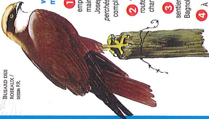
BUSARD DES ROSEAUX / DESSIN P.R.

Après un joli point de vue sur les villages perchés, accédez au tour du lac en suivant un sentier botanique mettant en valeur des espèces végétales méditerranéennes.