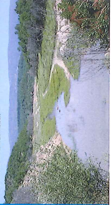
ANCIEN LAC DE MÉAULX

C'est pourquoi la commune seillanaise organise une Fête des fleurs tous les deux ans, à la Pentecôte : tandis que les rues s'agrémentent de compositions réalisées par les fleuristes de la région, les places et les fontaines sont laissées à l'imagination de jardiniers paysagistes. Par ailleurs, des expositions, des animations de rue, des cours d'art floral, des conférences et des foires animent le cœur historique de Seillans, classé parmi les « plus beaux villages de France ».