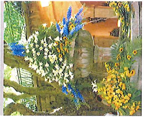
LA FÊTE DES FLEURS

Le pays de Fayence bénéficie d'un climat et d'un sol particulièrement favorables à la culture des fleurs. Cette dernière,