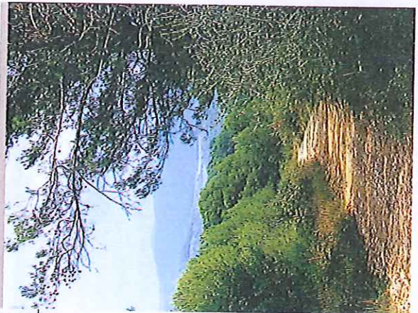
LAC DE SAINT-CASSIEN DEPUIS LE HAUT-SERMINIER

Le lac de Saint-Cassien s'inscrit dans un paysage boisé où le vert des pins et des chênes est égayé, en hiver, par l'or des mimosas. Aménagé en 1964 sur le cours du Biançon, cet immense plan d'eau – 430 hectares et 60 millions de mètres cubes d'eau – a la double vocation d'irriguer les cultures maraîchères des communes du littoral et de fournir l'énergie nécessaire au fonctionnement de l'usine hydroélectrique d'EDF. Les canadais viennent aussi s'y approvisionner lors d'incendies dans le secteur. Si la baignade, le canotage et la pêche attirent de nombreux touristes il convient toutefois d'observer des règles de prudence : brusques dénivelllements d'eau liés au barrage et écopage d'avions bombardiers.