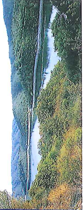
LAC DE SAINT-CASSIEN