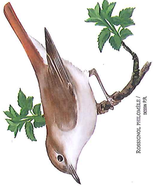
ROSSIGNOL PHILOMÈLE / DESSIN P.R.

6 Bifurquer à droite, franchir à nouveau un gué et remonter jusqu'au parking.