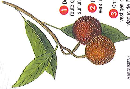
ARBOUSTIER / DESSIN N.L.

Dans un décor majestueux, ce site évoque la rupture du barrage, aux vestiges encore visibles, dont les eaux déferlèrent sur la ville de Fréjus dans la nuit du 2 décembre 1959.