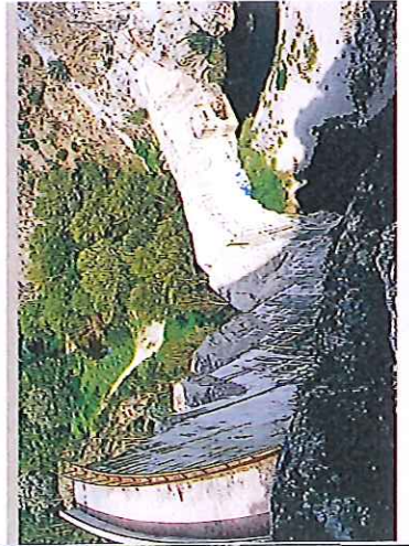
LE BARRAGE DE MALPASSET

Malheureusement, lors des pluies diluviennes de fin novembre 1959, il se rompit trop vite et ne put résister à la montée des eaux. Le 2 décembre 1959, à 21 h 45, il se rompit, laissant échapper une gigantesque vague qui, en quelques minutes, dévasta tout sur son passage et fit plus de 400 victimes.