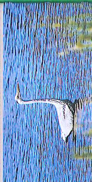
HÉRON CENDRÉ