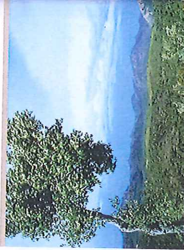
LE PIC DE L'OURS

L'Estérel est un massif quelque peu en marge de la côte touristique ; les routes le contourment, y pénètrent peu. C'est à la fois une montagne au-dessus de la mer et une grande mosaïque de forêts, de maquis, de rochers. Il reste encore une terre de découvertes que l'on gagne par des chemins forestiers : diversité de paysages, richesse de la flore et de la faune, nature sauvage et préservée. D'une superficie d'environ 30 000 ha, répartis entre le Var et les Alpes-Maritimes, l'Estérel se présente comme un immense cirque ouvert sur la mer. Sa ligne de crête incurvée se dessine, à l'ouest, avec le mont Vinaigre (618 m), puis au nord, les Suvières (525 m), à l'est,